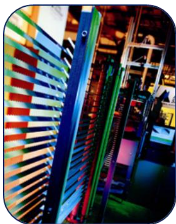
Formación de dientes

Mire la selección. Compare la calidad. ¡Usted verá que puede cortar cualquier cosa con las cintas de corte de una compañía que está un corte por encima - KASCO SharpTech!