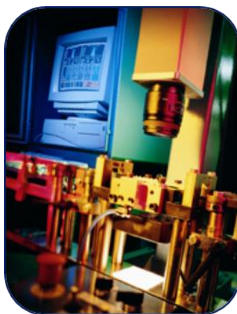
Inspección de dientes de sierra