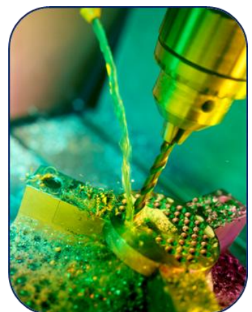
Perforación de discos amoladores